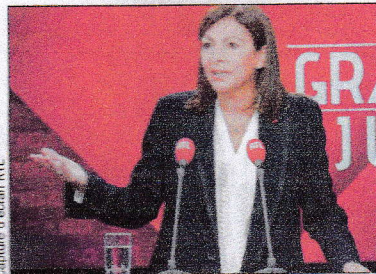
Cartoon d'élection RTL

Sous le titre « Aux larmes citoyens », en français dans le texte, l'hebdomadaire britannique revient sur le french paradox , celui de ce peuple heureux individuellement et malheureux collectivement. Parmi les explications, « un Etat central fort dirigé par un président doté d'importants pouvoirs qui suscitent des attentes excessives de l'un et de l'autre ».