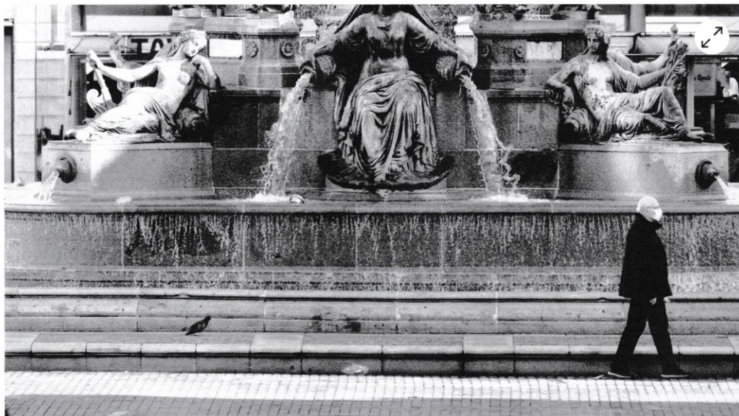
Le centre-ville de Nantes a été déserté pendant le deuxième confinement.

Les deux confinements de 2020 ont coûté 193 milliards à l'État. Une nouvelle restriction sanitaire renchérirait la note de vingt milliards par mois. Heureusement, les taux d'emprunt sont bas.